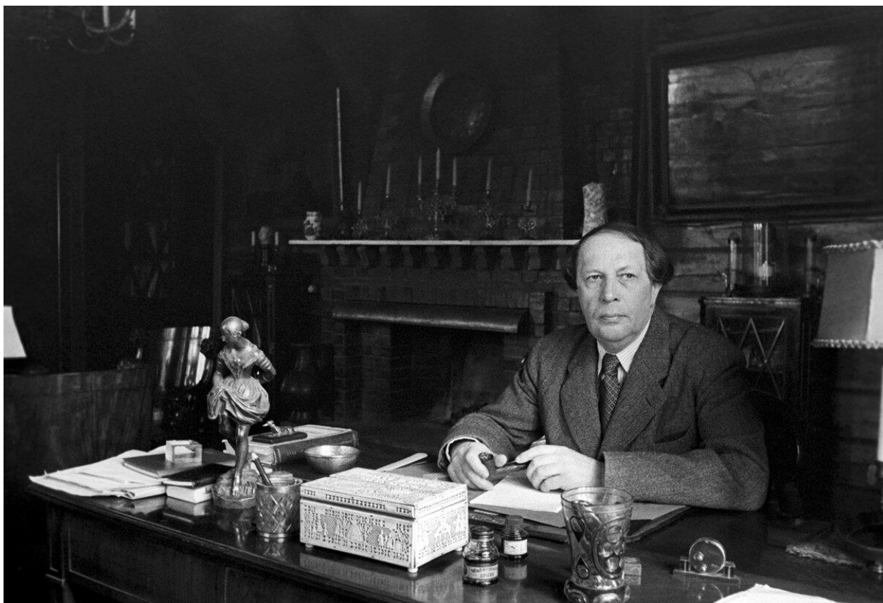
Алексей Николаевич Толстой (10 января 1883 г. – 23 февраля 1945 г.)