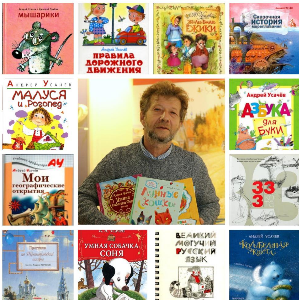
Андрей Алексеевич Усачев (Родился 5 июля 1958 года.)