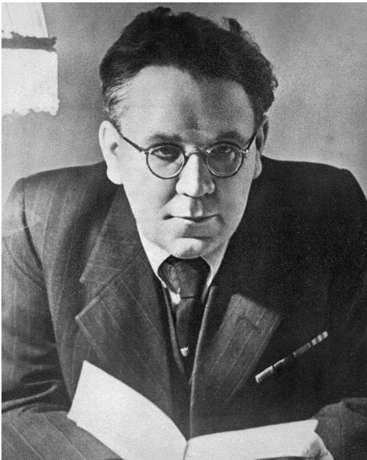
Самуил Яковлевич Маршак (3 ноября 1887 г. - 4 июля 1964 г.)