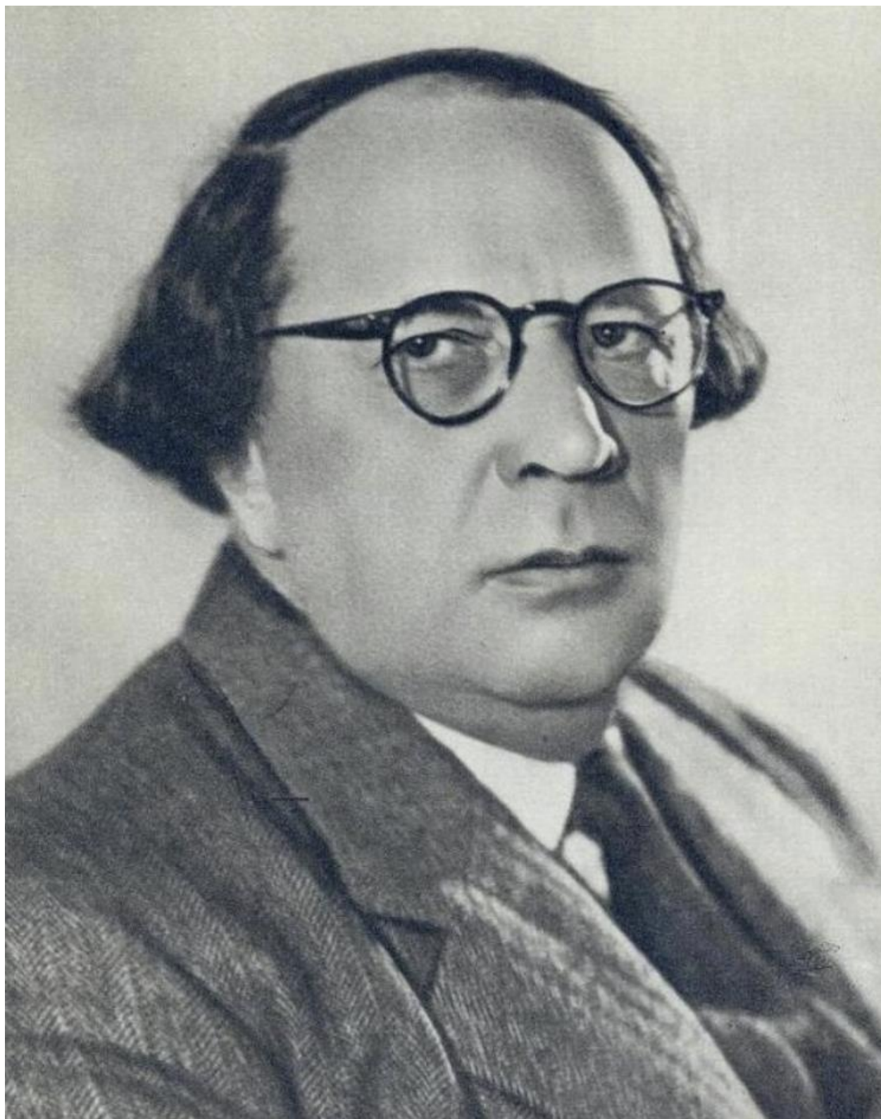
Алексей Николаевич Толстой (10 января 1883 г. – 23 февраля 1945 г.)