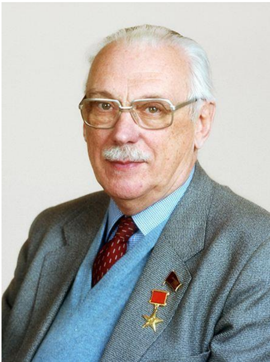
Сергей Владимирович Михалков (13 марта 1913 г. - 27 августа 2009 г.)